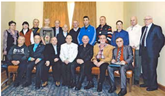
Клуб Ветеранов Ангарского Спорта (КВАС)