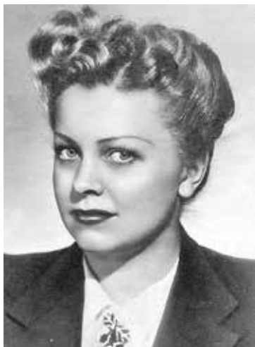
Людмила ЦЕЛИКОВСКАЯ Советская актриса (1919). «Я ничего не боялась в этой жизни»