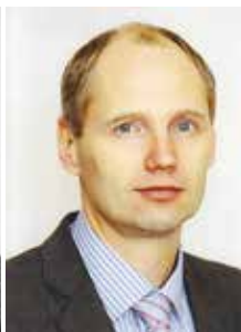
И.Г. Резник, министр спорта Иркутской области (2017 г.)

«ИНОЕ ПОКОЛЕНЬЕ НА ЗАМЛЕ НЕСУТ ВСЕ ДАЛЬШЕ ЖИЗНИ ЭСТАФЕТУ»