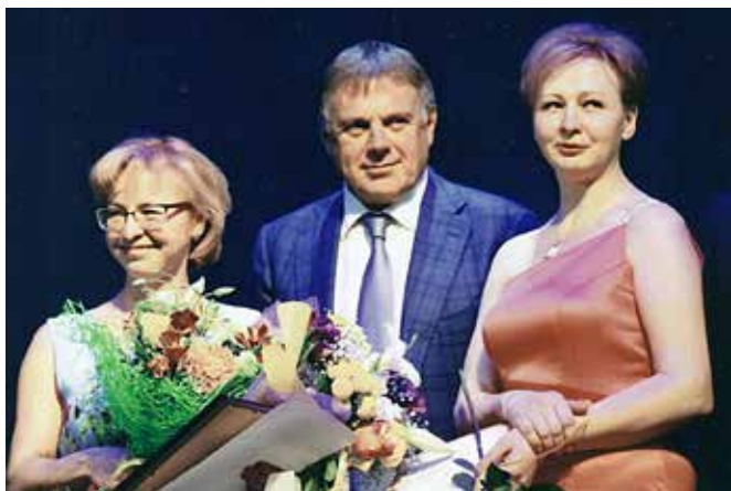
Мэр города Ангарска С.А. Петров среди ангарских красавиц

От дворника, слесаря, предпринимателя, учащего, полицейского, директора, депутата... – до Мэра города.