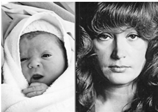
Максим Галкин и Алла Пугачева в 1976 году