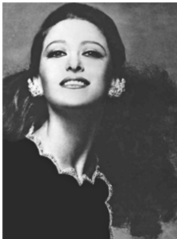
Мая ПЛИСЕЦКАЯ Советская артистка балета (1925). «Одежда диктует поведение».