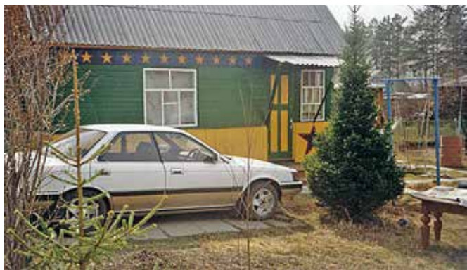
Моя бывшая дача