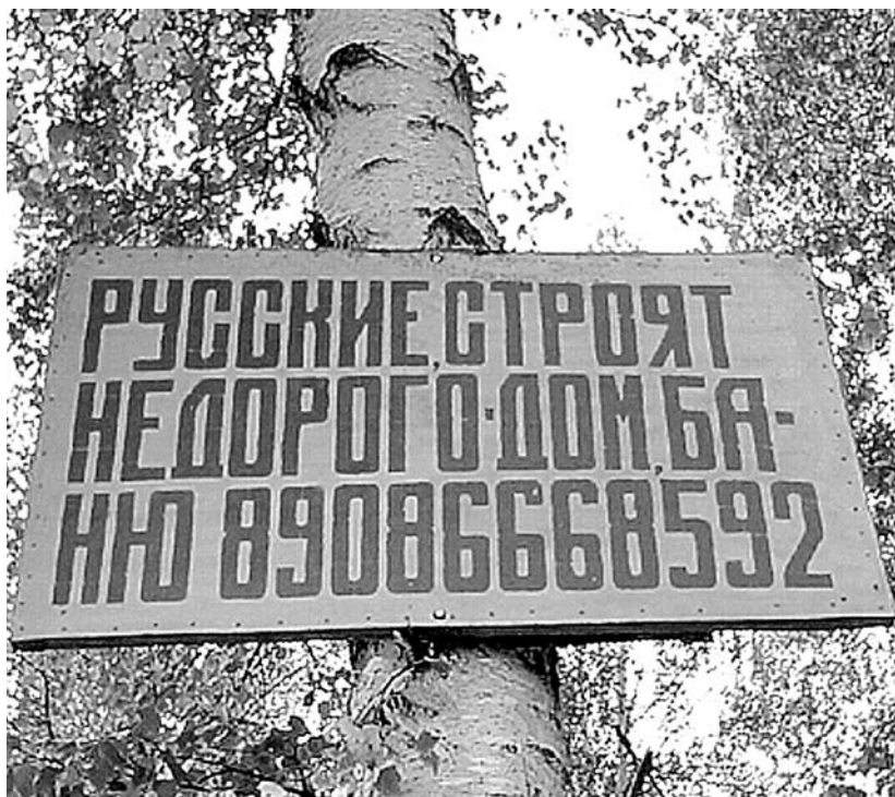
Рис. 1. Объявление в районе дачно-коттеджного массива в 7 км от Иркутска, август 2010 г.

«К сожалению, к большому сожалению, если иностранцы берут в свои бригады русских мужчин, то это те мужчины, которые вот, знаете, не сильно умелые — «копайки», «копалки» вот называют. Вы знаете, вот те, которым невозможно доверить сложную работу... А всегда, когда работы строительные, есть работы «копальные», можно сказать, для того чтобы положить фундамент, нужно вначале выкопать ров, где-то это техника, где-то ручная работа. <...> И вот, кто такие «копалки» — те, кто мешает ростор там палкой, ну ... почему-то русские, как правило, на подмоге. А так, чтоб постоянно в бригаде был... — я по крайней мере не могу сказать».