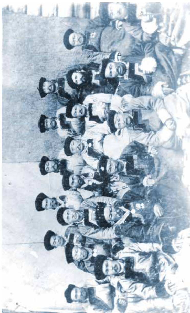
Должностные лица Хоринской Степной думы