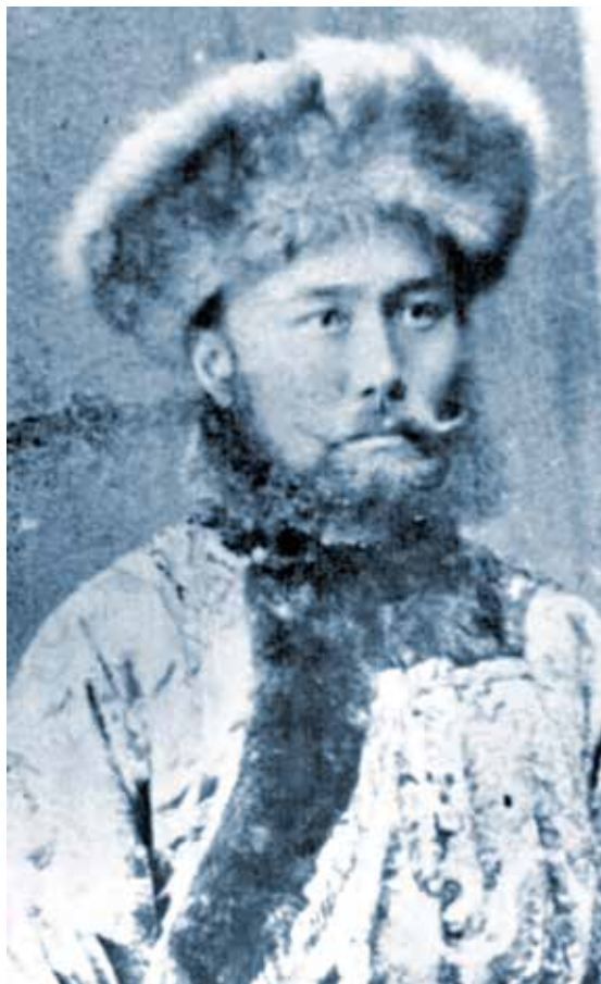
Последний тайша хоринских бурят Эрдэни Вамбоцыренов