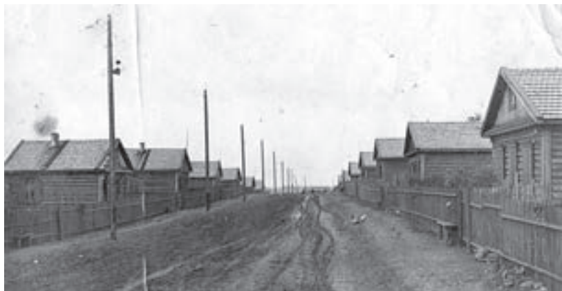
ул. 1-я Советская. 1954 г.

нарник, птичник разместили на берегу Иркута в двух километрах от зимовья и строений Чупрова. Пойменные пастбища и сенокосы — эти причины явились главными в «переезде» деревни на новое место. Строения Чупрова на время почти опустели — 17 семей переехали в бараки на берег Иркута. Но этот «переезд деревни» оказался ошибочным — каждый год Иркут выходил из берегов и грозил затопить хозяйственные и жилые постройки. К 1941 году старые постройки на берегу ручья вновь были восстановлены и построены два барака и баня. Был построен большой хозяйственный сарай, в котором размещался зерновой склад, мельница, конный двор, хомутная и столярная мастерские. Главной тягловой силой на пахоте и перевозках грузов были быки и лошади. Большим облегчением для крестьян стал колесный трактор СТЗ, который заменял 7-8 пар быков на пахоте. С особой радостью встретили новость об открытии на берегу Иркута начальной школы в большой комнате жилого дома.