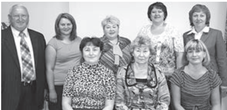
Коллектив администрации Мамонского муниципального образования

В Мамонское муниципальное образование входят пять населенных пунктов: с. Мамоны, д. Малая Еланка, п. Западный, п. Южный, з. Вдовина. Общая площадь составляет 12 762 га. Население муниципального образования 4521 человек. Основная часть населения — старожилы, те, кто несколько десятков лет назад приехал сюда, обзавелся семьей, проработал всю жизнь и навсегда поселился на этой земле. На селе жизнь каждого на виду. То же самое можно сказать и о тех, кто трудится в органах власти. Односельчане каждый шаг, каждое принятое решение видят и расценивают.