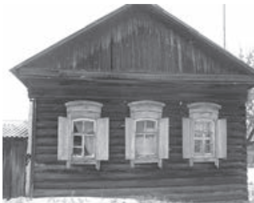
Дом бывшего фронтовика Е. Мазутова

ливается дисциплина, к работе в цехах привлечены 16-летние учащиеся ФЗУ. Для обеспечения завода квалифицированными кадрами срочно началось расширение заводского и строительство ремесленного училищ. Из угрожаемых районов по приказу ГКО необходимо было вывезти на восток целые заводы и в кратчайшее время наладить производство оружия. По приказу ГКО и Совета по эвакуации № 14323с от 6 октября 1941 года из Москвы эвакуируется авиационный завод № 39 имени Менжинского. Было перевезено в течение декабря 1941 года 17000 рабочих и специалистов завода № 39. Бюро Иркутского обкома ВКП(б) на своем заседании рассмотрело вопрос «О размещении эвакуированного завода № 39 имени Менжинского» и постановило «...обеспечить завод бесперебойным снабжением продуктами питания... и выделить районы для дополнительной заготовки картофеля и овощей...». Таким образом, три хозяйства – «Труженик», «Ударник» и «Максимовское» – были переведены