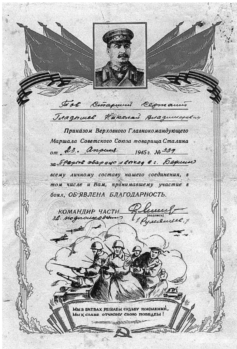
ГАНИИО. Ф. Р 3374. ОП. 1. Ед. хр. 47. Л. 1.