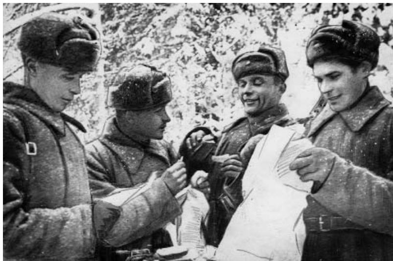
Бойцы и командиры получают подарки. 1942 г. Северо-Западный фронт. ГАНИИО. Ф. 6731. Оп. 2. Ед. хр. 61. Л. 22.