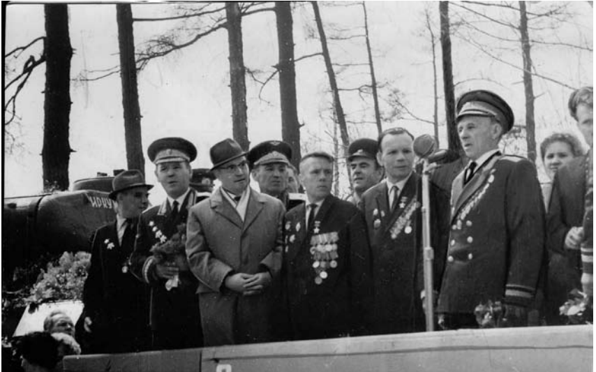
На открытии мемориала танка «Иркутский комсомолец», май 1967 г. В центре Герои Советского Союза – иркутяне И.А. Рубленко и А.Ф. Смирнов.