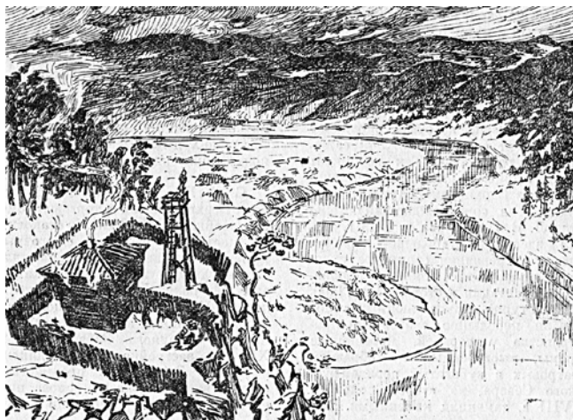
Удинское зимовье. Реконструкция Л.К. Минерта