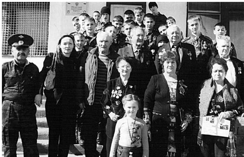
2011 год. «Эстафета памяти». Встреча малолетних узников концлагерей в кадетском корпусе