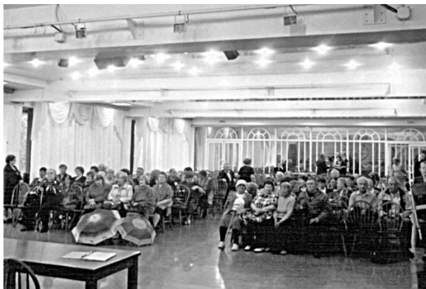
28 июня 2013 г. «Дети войны», малый зал ДК «Химик». Итоговое собрание

Сегодня в организации встали на учет 4863 человека, в том числе 150 вдов участников Великой Отечественной войны, 50 одиноко проживающих пенсионеров. Более 800 человек, вставших на учет, вообще не имеют каких-либо льгот и живут на минимальную пенсию. Актив организации участвовал в мероприятиях городского Совета ветеранов, ежемесячно проводились заседания совета, еженедельно по четвергам проводится работа с новыми членами организации по вопросу регистрации. Велась систематизация учета членов по ветеранским организациям.