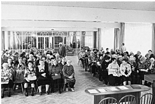
28 июня 2012г. Учредительное собрание «Дети войны» Малый зал ДК «Химик» г.Усолье-Сибирское

26 июня 2013 года этот вопрос обсуждался в Законодательном Собрании Иркутской области. Было принято решение о признании статуса «Дети войны» – пожилых людей, родившихся с июня 1923 по 3 сентября 1945 года, выдать им соответствующее удостоверение и с 1 января назначить им некоторые льготы, в том числе социальную выплату в размере 383 рублей тем пенсионерам, кто не имеет каких-либо льгот. Таких в области около 21 тысячи человек. Пенсионеры, относящиеся по возрасту к «детям войны», в основном имеют трудовой стаж, достаточный для получения губернаторского денежного вознаграждения. То есть, вся добавка сводится к 20 рублям. Да еще какое-то сомнительное на деле первоочередное медицинское и социальное обслуживание. Так что, кроме удостоверения, «дети войны» практически ничего не получат. Поэтому наши требования остаются теми же, что указаны в Обращении организационного собрания.