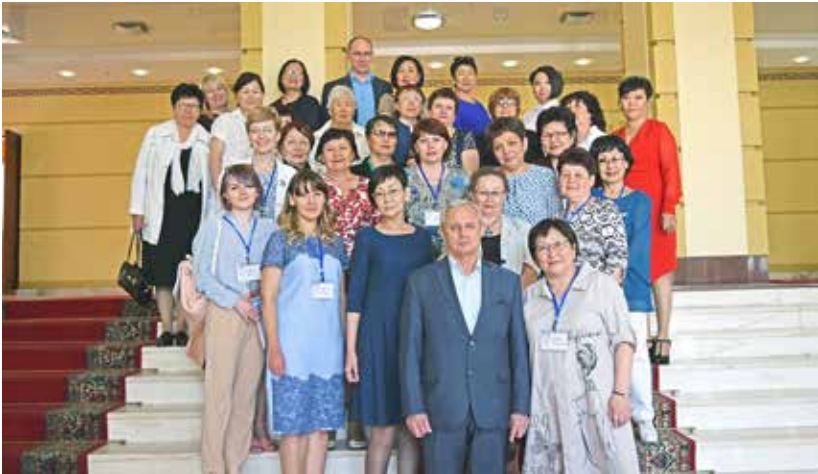
Участники Всероссийской научно-практической конференции «Архивы в истории. История в архивах», посвященной 100-летию государственной архивной службы России, 95-летию архивной службы Республики Бурятия и 140-летию В.П. Гирченко, историка, архивиста, краеведа, основателя архивной службы Республики Бурятия. г. Улан-Удэ, Дом Правительства Республики Бурятия. 7 июня 2018 г.