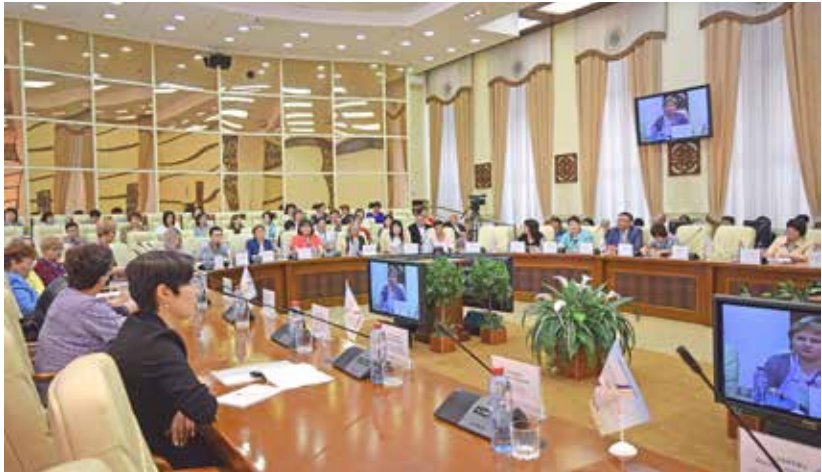
Всероссийская научно-практическая конференция «Архивы в истории. История в архивах». г. Улан-Удэ. 7 июня 2018 г.