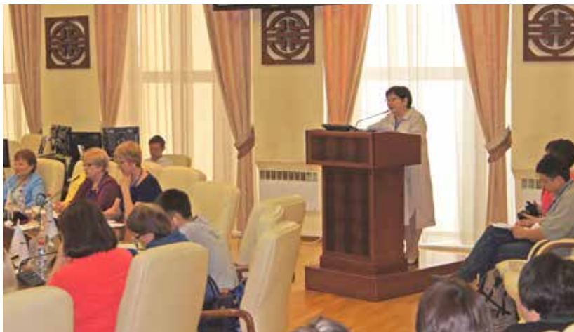
Всероссийская научно-практическая конференция «Архивы в истории. История в архивах». Выступает д.и.н., директор Государственного архива Республики Бурятия Б.Ц. Жалсанова. г. Улан-Удэ. 7 июня 2018 г.