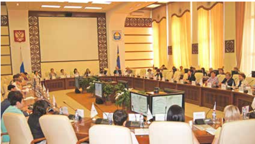
Всероссийская научно-практическая конференция «Архивы в истории. История в архивах», посвященная 100-летию государственной архивной службы России, 95-летию архивной службы Республики Бурятия и 140-летию В.П. Гирченко, историка, архивиста, краеведа, основателя архивной службы Республики Бурятия. г. Улан-Удэ. 7 июня 2018 г.