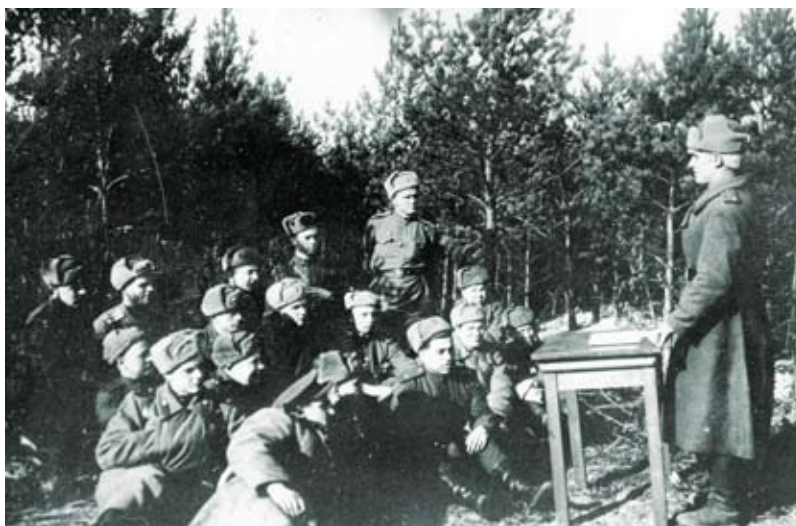
Инструктаж политработников дивизии