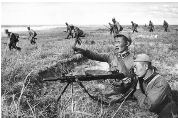
Бои в районе реки Халхин-Гол 11 мая – 16 сентября 1939 г.

Для её проведения по просьбе Военного совета в 1-ю армейскую группу войск было направлено подкрепление. Часть войск Забайкальского военного и пограничного округов была переброшена в район военных действий. В Иркутской, Читинской областях, Бурят-Монгольской АССР проведена частичная мобилизация военнослужаших запаса. В Читинской области к июлю было призвано около 30 тыс. запасников. Забайкалье стало прифронтовым тылом: промышленность, транспорт, связь, сельское хозяйство, медицина обслуживали сражающиеся войска [12].