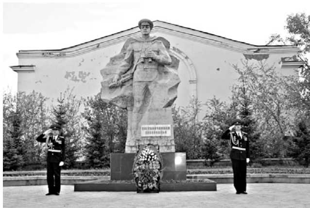
Памятник пограничникам Забайкалья в г. Чите

материально-техническое оснащение. Это диктовалось необходимостью укрепления забайкальского участка государственной границы на фоне увеличения численности японской армии вдоль советско-маньчжурской границы и количества провокаций с их стороны.