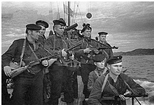
Пограничники в походе

границы. Каждый из укрепрайонов занимал до 100 км по фронту и не менее 50 км в глубину. Строили их не сами японцы, а китайцы и монголы, которых после завершения строительства японское командование расстреливало в целях сохранения тайны. Оно полагало, что маньчжурский железобетонный пояс неприступен, называло его «бансей дзиоокаку» – «вечная стена», точнее, «стена, запертая на замок навечно».