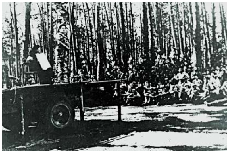
Выступление артистов Москвы перед бойцами и командирами дивизии. Октябрь 1944 г.