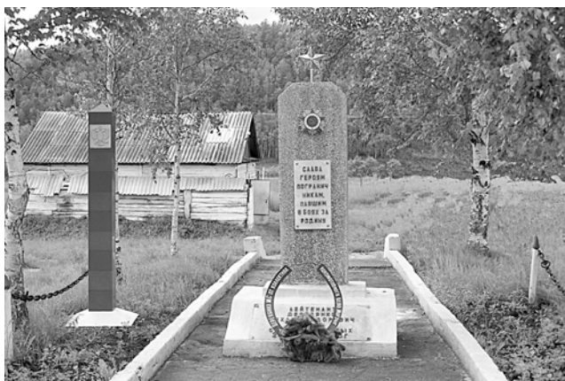
Памятник М.С. Деревянко на заставе

Боевой и патриотический подвиг забайкальских пограничников получил достойную оценку советского командования.