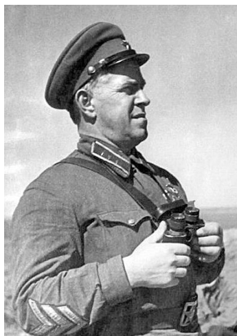
Командующий 1-й армейской группой советских войск в Монголии комкор Г.К. Жуков. МНР, Халхин-Гол, 1939 г.

Поражение японской армии в боях в районе озера Хасан не только не убедило японские правящие круги в авантюристичности планов антисоветской войны, а, наоборот, вызвало стремление