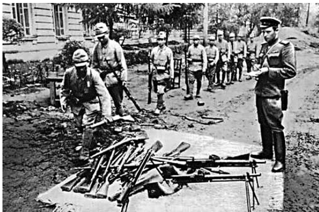
Сдача оружия японцами

Как уже отмечалась, в тот же день, 14 августа, император Хирохито обратился к японской армии с требованием о прекращении сопротивления и начале капитуляции. Но это требование не относилось к Квантунской армии, войска которой продолжали оказывать отчаянное сопротивление, проявляя при этом готовность применить бактериологическое оружие.