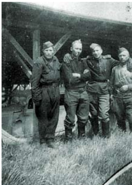
Шоферы транспортного взвода 65-го ОМСБ