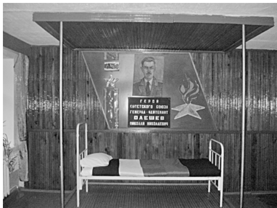
Комната боевой славы им. Н.Н. Олешева на заставе

изобличению ряда японских шпионов и военных преступников, пытавшихся уйти от ответственности за совершенные ими преступления, а также упорядочению системы пропуска через государственную границу советских и иностранных граждан.