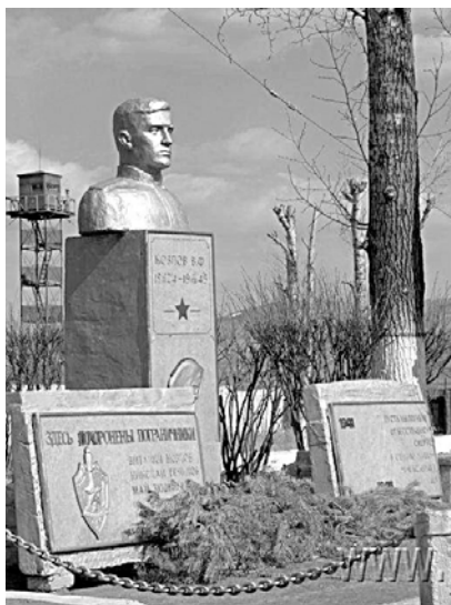
Памятник В. Козлову на заставе

в Забайкальском крае заметно улучшилась. Но хотя регион достаточно спокойный, на переднем плане остаются такие направления деятельности, как борьба с международным терроризмом и трансграничной преступностью, наркотрафиком, незаконной миграцией и контрабандой. Чтобы эффективно противодействовать нарастающим угрозам, необходимо постоянно усиливать оперативную составляющую пограничных органов, модернизировать войсковую составляющую охраны государственной границы. Уроки служебно-боевого использования пограничных войск Забайкалья в предвоенные и военные годы являются поучительными.