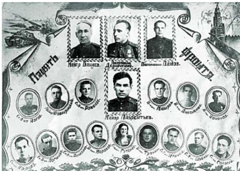
Работники политотдела 106-й стрелковой Забайкальско-Днепровской краснознаменной ордена Суворова 2-й ст. дивизии