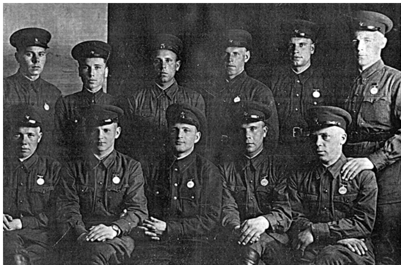
Пограничники Даурского погранотряда – участники боев на Халхин-Голе, награжденные медалью «За отвагу»

Одной из главных задач пограничного округа, отрядов и застав была борьба с подрывной деятельностью иностранной разведки. Советским руководством в предвоенные годы принимались дополнительные меры по упрочению обороноспособности восточных рубежей государства, повышению боеготовности пограничных войск, особенно на наиболее важном направлении – забайкальском участке советско-маньчжурской границы.