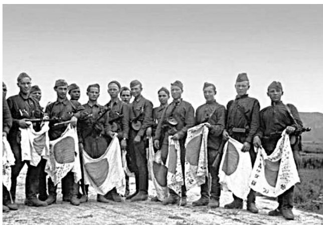
Пограничники с трофейными японскими знаменами

Пограничники-забайкальцы впервые за всю историю пограничных войск участвовали в операции вторжения. Специально сформированные из их числа и натренированные отряды нападения пограничных войск форсировали водные преграды, перешли границу и атаковали опорные пункты и гарнизоны японцев, внезапными ударами ликвидировали их, обеспечивая наступление армейских частей.