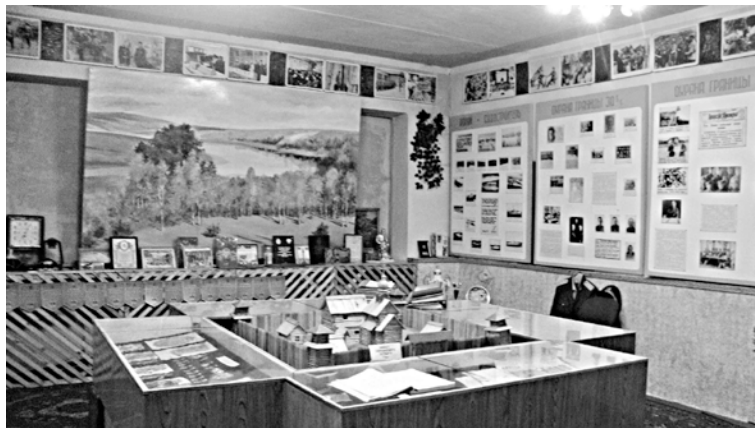
Музей пограничного отряда

привлечением приграничного населения к охране границы, созданием из их числа добровольных народных дружин и бригад поддержки пограничников;