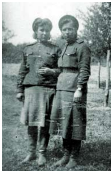
Фронтовые подружки – медицинские сестры 65-го ОМСБ