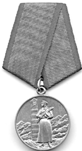
За отличие в охране Государственной границы СССР

бой самостоятельное государство Маньчжоу-Го, и, следовательно, на её вооруженные силы, а также войска Внутренней Монголии капитуляция не распространяется». Заканчивалось послание указанием императорской ставки, которая подчеркивала, что согласие Японии на выполнение Потсдамской декларации ни в коем случае не распространяется на Маньчжурию и её вооруженные силы. Это полностью развязывало руки Ямаде, его войска продолжали ожесточенное сопротивление [16].