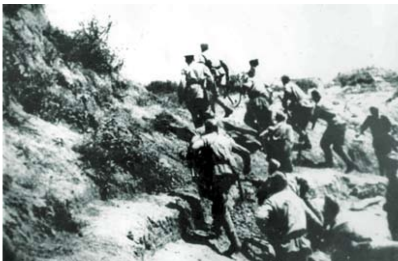
Атака началась! Вперед, за Родину!