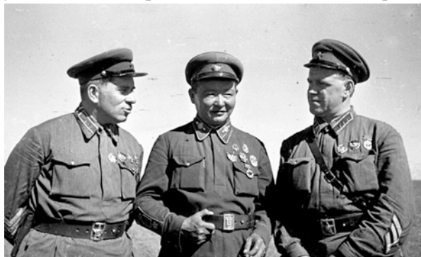
Слева направо: командарм 2 ранга Г.М. Штерн, Маршал МНР Х. Чойбалсан и комкор Г.К. Жуков на командном пункте Хамар-Даба, 1939 год.

ную дорогу, а затем, в случае успеха, захватить обширную территорию от Иркутска до Владивостока. Считалось, что нанесение удара с западного направления следует предпринять до того, как СССР укрепит здесь свою обороноспособность. Японские стратеги полагали, что, действуя на расстоянии 800 км от ближайшей железнодорожной станции, советские войска не смогут организовать подвоз подкреплений и материальное обеспечение частей. С другой стороны, Квантунская армия, планировавшая действия в районе, отстоявшем на 150-200 км от железной дороги, заранее подготовила базы снабжения. В докладе командования Квантунской армии генштабу сообщалось, что Советскому Союзу для ведения боевых действий на западном направлении придется «затратить усилий в десять раз больше, чем японской армии» [2].