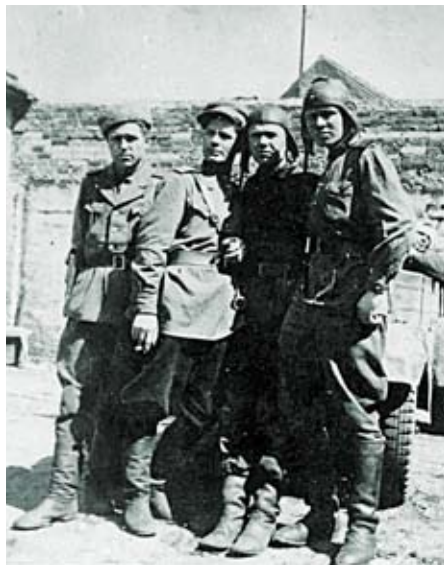
Разведчики: боевые друзья-товарищи