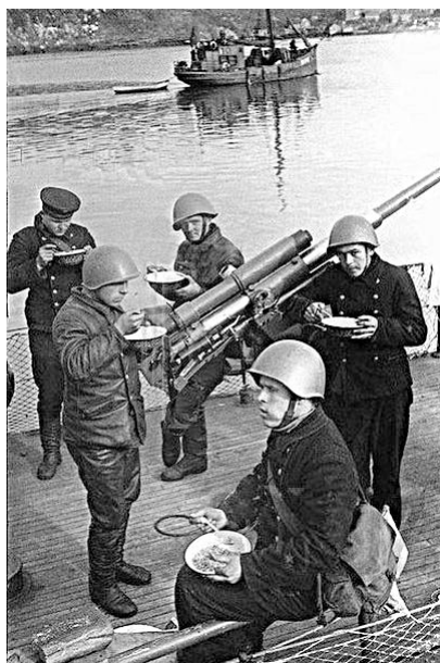
Пограничные катера в походе

5 апреля 1945 г. СССР, выполняя решения Крымской конференции, в частности, о сроках вступления СССР в войну с Японией (через два-три месяца после окончания войны в Европе), а также свои союзнические обязательства перед США и Великобританией, расторг советско-японский договор о ненападении, заключенный 13 апреля 1941 г., и 9 августа вступил в состояние войны с Японией. Весной-летом японское правительство делало