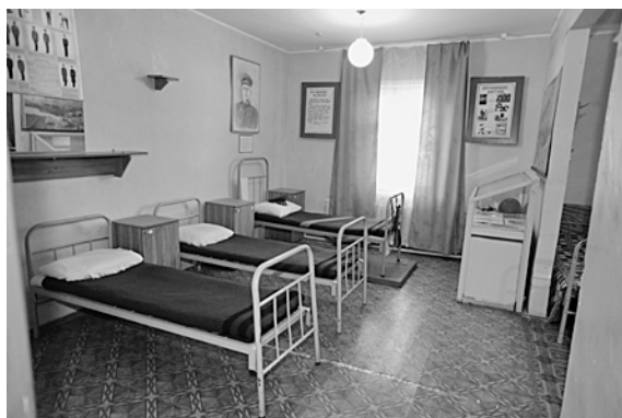
Музей памяти М.С. Деревянко на заставе

В целом умелым проведением этого комплекса мер пограничные войска Забайкалья выполнили задачи по обеспечению надежной охраны границы и нормализации обстановки в зоне советско-маньчжурского приграничья в первое послевоенное время.