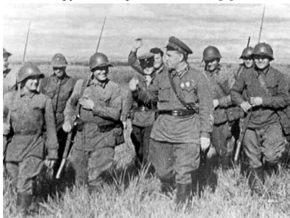
Район реки Халхин-Гол, июль 1939 г.

Эти данные подтверждались действиями японской армии на забайкальском и других участках границы. За первые три с половиной месяца 1939 г. японцы совершили более 30 нарушений границы, на территории МНР расширялась агентурная сеть. В маньчжурском прикормоне японцы усилили военные гарнизоны, провели паспортизацию населения и другие режимные мероприятия. Участились случаи вооруженных нападений на пограничные наряды, выброски на забайкальскую территорию диверсионных банд для захвата пограничных нарядов и проживающих в приграничной зоне граждан, имели место другие диверсионные акты [3].